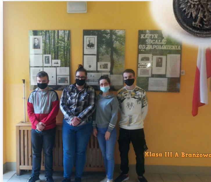
Klasa III A Branżowa